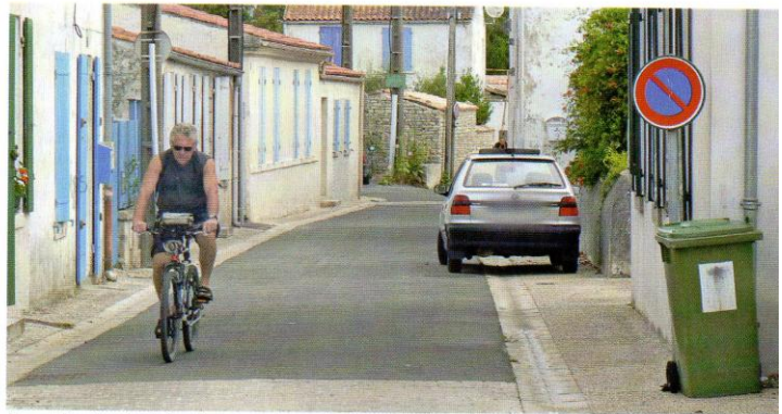
Requalification des infractions pour les stationnements gênants.

Faisant suite à la démarche du Code de la rue et après deux ans d'études et de réflexions dans les divers groupes techniques, les vingt et une premières mesures validées par le ministère des Transports en mars 2014 ont enfin vu le jour. La parution du décret n° 2015-808 du 2 juillet 2015 suivie de l'arrêté du 23 septembre 2015