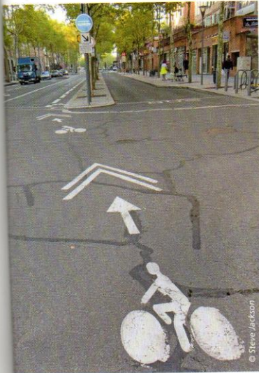
Trajectoire matérialisée pour les cyclistes.