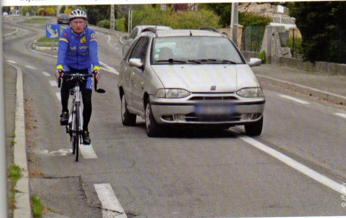
Autorisation du chevauchement de la ligne axiale continue pour le dépassement de cycliste sous certaines conditions de sécurité.

km/h ou moins, il permet aux cyclistes de s'écarter des véhicules en stationnement sur le bord droit de la chaussée.